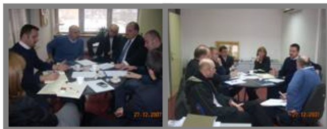
Sastanak RG za promociju

☛ Na sastanku je odlučeno da je potrebno utvrditi datum prelaska na digitalnu kao i definisati područja gdje će se krenuti sa Pilot projektom, kao i područja jače marketinške moći.