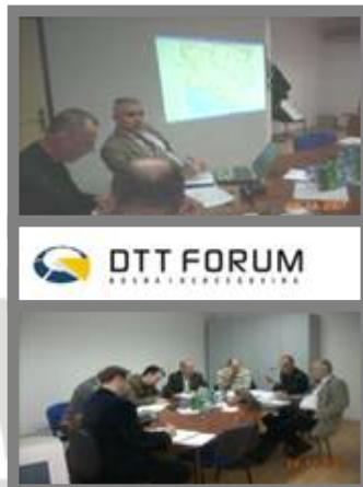
Sastanak RG za tehniku

☛ U narednom periodu, članovi RG u suradnji sa članovima iz RAK-a raditi će na definisanju okvira idejnog rješenja koje uključuje i elemente za pilot projekt.