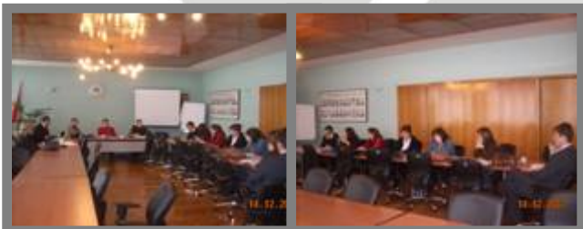
Zajednički sastanak radnih grupa (RG5 i RG2)

☛ Na sastanku su definisane tri interesne skupine: građani, TV stanice i ostale interesne skupine.