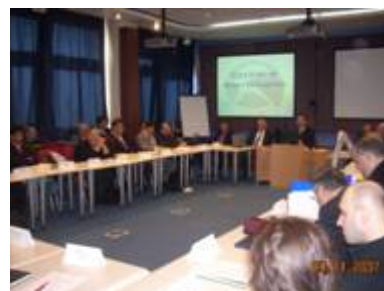
Druži plenarni sastanak